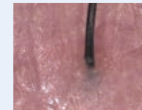
赤みが強く かゆみがある