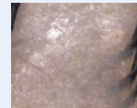
頭皮が硬く かさついている