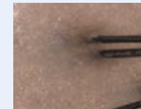
黄みが強く 毛穴がふさがっている