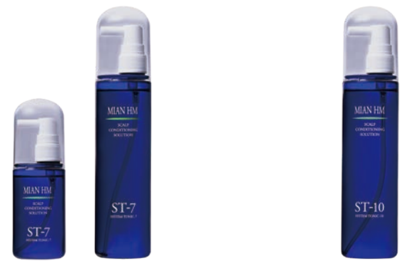
システムトニック 7