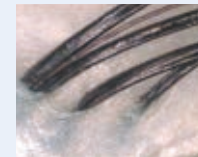
みずみずしく 透明感がある

ハーブマジックでは、お客様一人ひとりの髪と頭皮を 健康な状態へ導くための重要なファーストステップとして、 頭皮診断をおすすめしています。