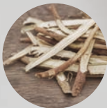
β-グルチルレチン酸